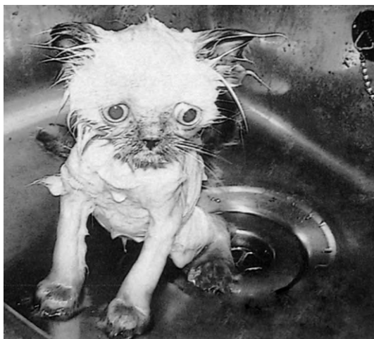
Chupi después del baño

T rate de imaginar la cara de los dueños de este gato cuando vieron su horrible aspecto después de su primer baño. Y habían pagado por él más de 300 €, que es el precio que se paga por los gatos persas como éste si no se compra uno en un asilo de animales. Así que le hicieron una foto (izquierda), que presentaron a un concurso anual de gatos feos y... ¡se llevaron el primer premio!